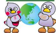
埼玉県マスコット 「コバトン」と「さいたまっち」