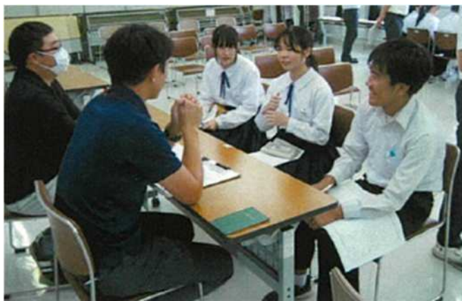
町役場の方と住みよい町づくりについて意見交換している様子