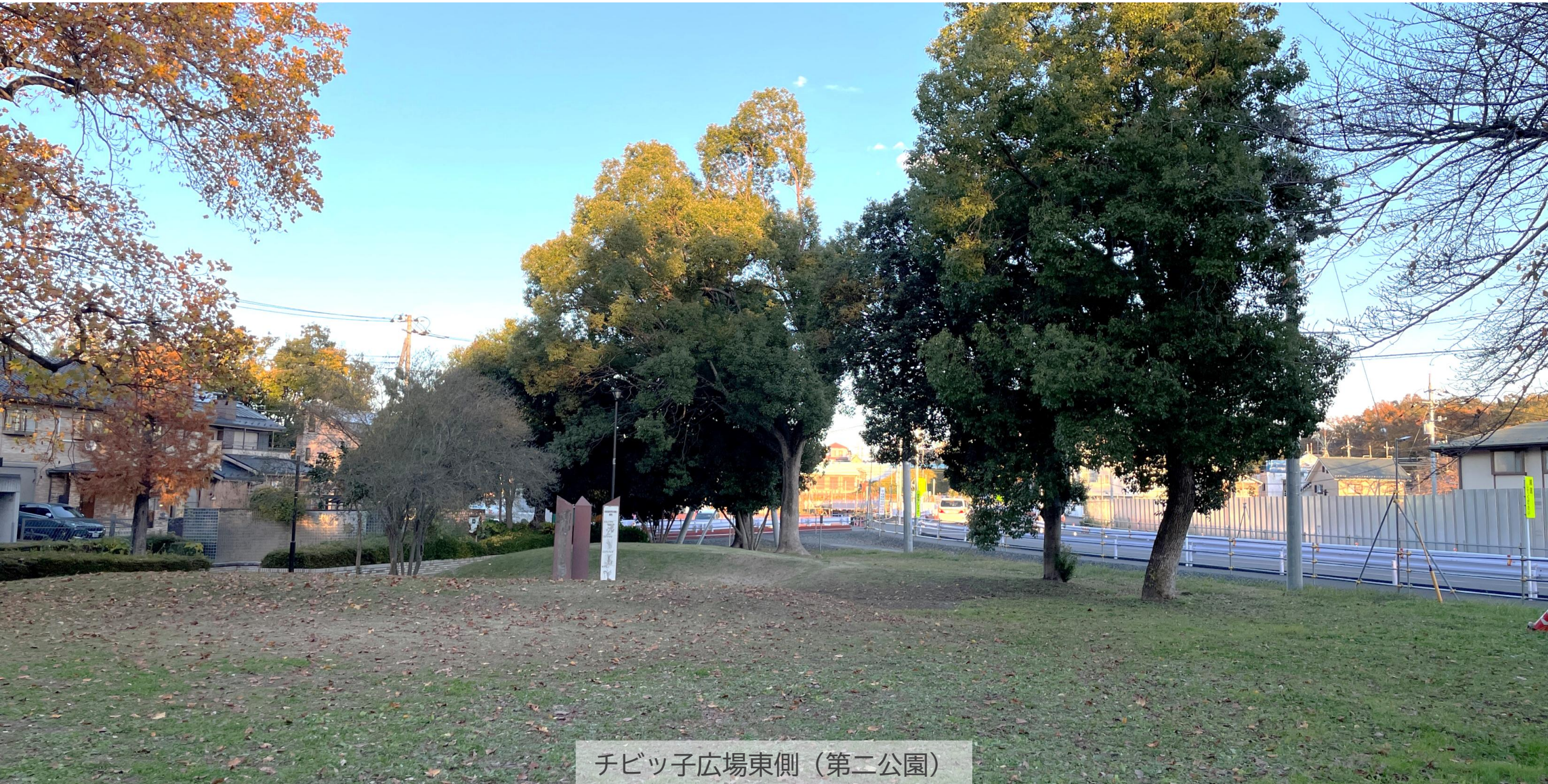
チビッ子広場東側（第二公園）