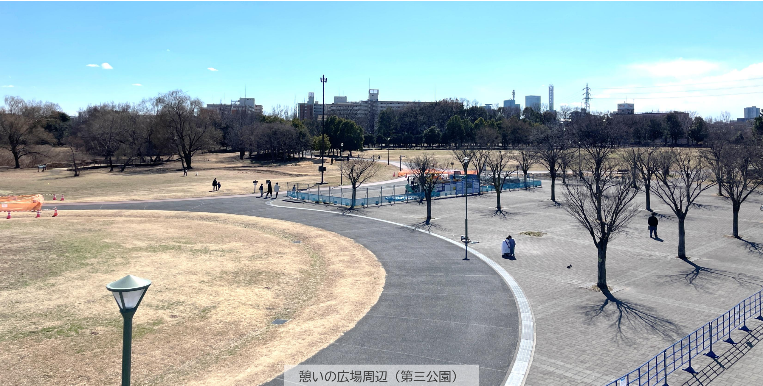
憩いの広場周辺（第三公園）