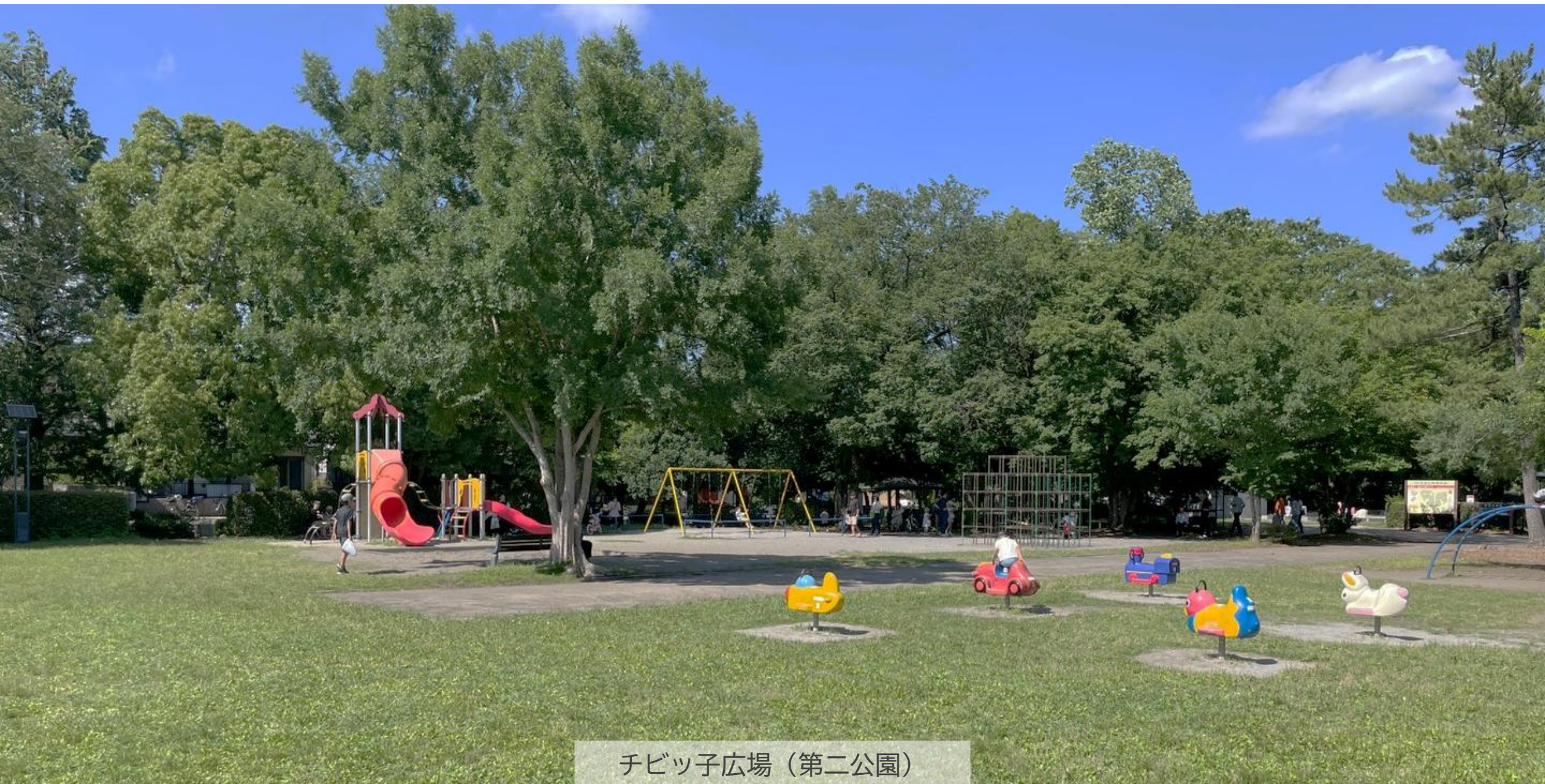
チビッ子広場（第二公園）