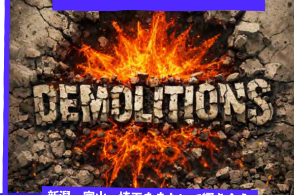
新潟・富山・埼玉をまたいで響き合う、 かつてないロックンロール・アライアンスが、いま動き出す。