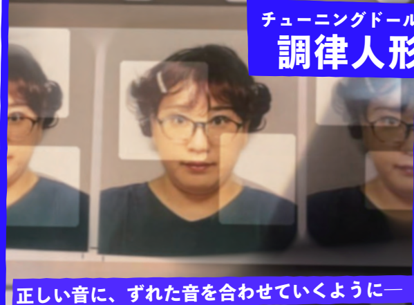
正しい音に、ずれた音を合わせていくように— 二人と一体の人形が起こす化学反応！