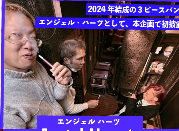
エンジェル ハーツ Angel Hearts