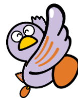
埼玉県マスコット コバトン

県では、商店街の様々な課題の解決に取り組む事業者の皆様や商店街を側面から支援する市町村・商工団体職員を対象とし、商店街の活性化に向けて後押しをしていくため、課題に応じた全4回のセミナー・ワークショップを実施します。