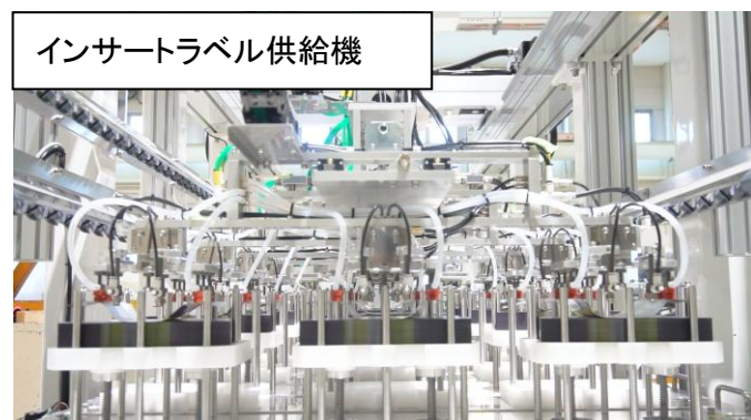
インサートラベル供給機