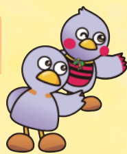
埼玉県マスコット 「コバトン&さいたまっち」