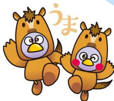
「コバトン」「さいたまっち」