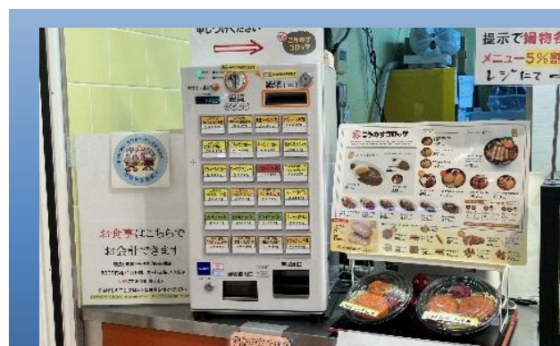
「こうのすコロッケ」店舗内の自動券売機

券売機の導入により、繁忙時間を中心に1日の売上の3分の1から4分の1程度を同機で販売できるようになった。また機械決済のため、金銭の授受に間違いがなく、正確な販売ができるようになった。