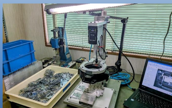
自社の固定具と合わせた AI × 光学ズーム搭載ビジョンシステム

1製品当たりの検査時間は従来の30～60秒から5～10秒へと短縮され、工数は約1/6に削減。5,000個当たりの検査時間も最大83時間から14時間に短縮された。長期にわたった検査員の育成も作業指導のみで済むようになり、未経験者の即戦力化が可能となった。