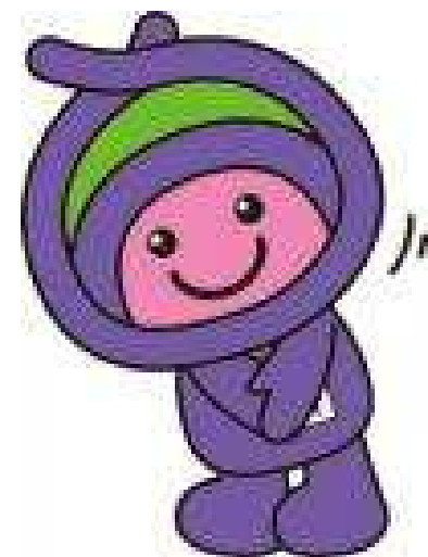
上尾市イメージキャラクター「アッピー」