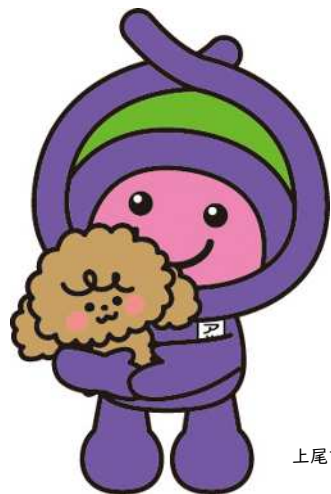
上尾市イメージキャラクター「アッピー」