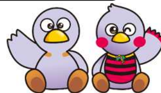
埼玉県マスコット 「コバトン&さいたまっち」

埼玉県公立高等学校入学者選抜の出願、学力検査、入学許可候補者発表の情報に加え、志願者倍率、学力検査得点の閲覧などの情報をお知らせします。