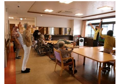
梅干し体操:職員と一緒に利用者も行う:毎日10時