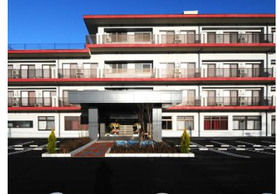
特別養護老人ホームてねる

食事・排泄・入浴介助・健康管理・日常生活支援等、介護を必要とする介護度3以上の高齢者の方を受け入れ、24時間体制でサービスを提供しております。デイサービスは併設されています。