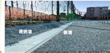
雨水流出抑制対策（校庭貯留等）