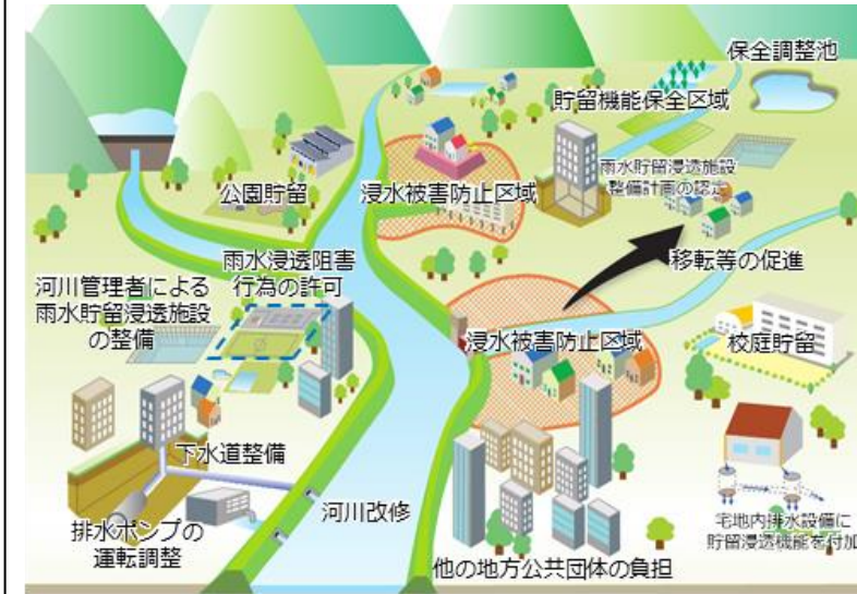
特定都市河川の取組イメージ

予算の重点措置（国庫補助）による河川整備等の加速化や法的枠組みを活用した雨水流出抑制対策等、流域治水をより強力に推進