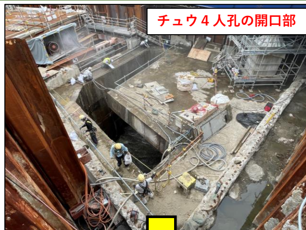
チュウ4人孔の開口部

皆様にはご迷惑をおかけしますが、細心の注意を払い作業を進めてまいりますので、復旧工事へのご理解とご協力をお願い申し上げます。