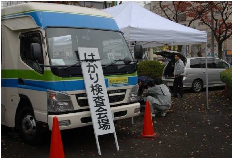
機械式はかりの定期検査