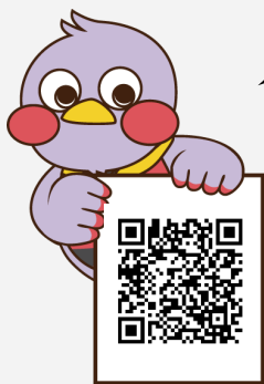
埼玉県マスコット 「さいたまっち」