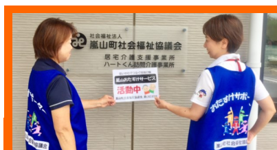
嵐山町社会福祉協議会の2人ボランティアが作業中に着用するベストを着て撮影☆

注目② 他にも、庭の草むしりの依頼でしゃがんで草をむしる作業をボランティアが行い、草を捨てるための袋詰めは利用者が行うなど、役割分担をした例もあります。