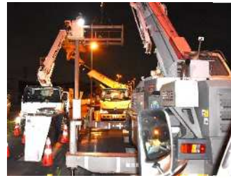
新たに電気通信工事業へ参画