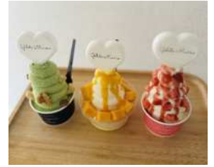
地域農産物を使用した オリジナルジェラート