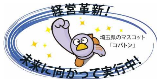
埼玉県経営革新計画承認企業

ぜひとも経営革新計画にチャレンジし、承認を受けられた後はシンボルマークをご活用ください。