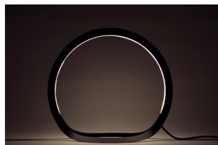
オリジナル製品 スタンド照明 「HOOP」