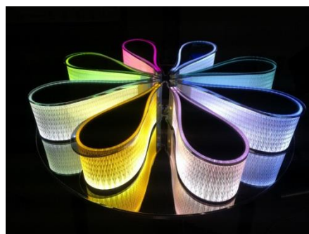
様々な色に 光らせることも 可能