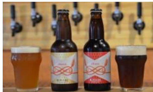
武蔵一宮氷川神社をイメージしたクラフトビール「氷川の杜」シリーズ

◇各種イベントへの積極的な出展などの結果、マスメディアでも多数取り上げられている。更なるブランド化を図ることで、地域の名産品としての土産品や贈答品としての需要が期待される。