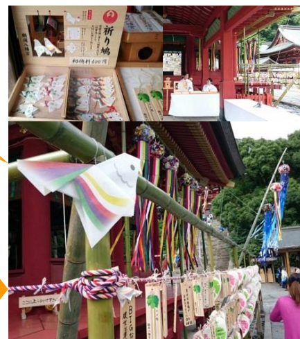
元の鳩の形に戻し、神社へ奉納する