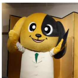
オフィシャルキャラクター「ヴェルペンくん」