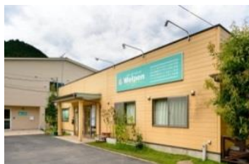
デイサービス「スマイルテラスはらいちば」