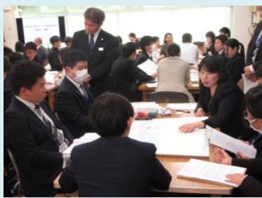
『私の授業の観てほしいポイント』に沿った研究協議