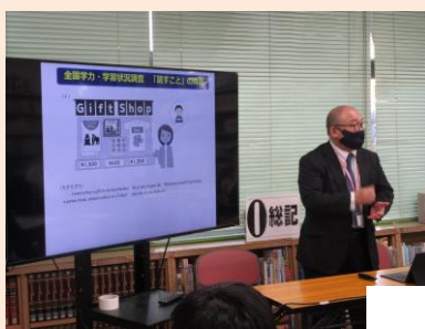
指導・助言（指導者から）