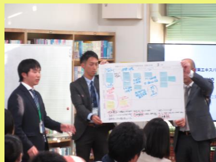
各班の協議内容の発表