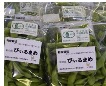
写真3 上里町の有機農業の取組 （共通マークを使った有機エダマ メの出荷）