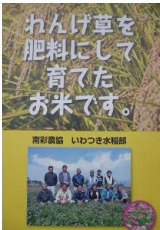
写真1 さいたま市のカバー クロープ（レンゲ）の取組

上里町の取組団体では、栽培方法を統一するとともに有機 JAS 認証を取得し、共通マークをつけてエダマメの出荷を行っている（写真3）。