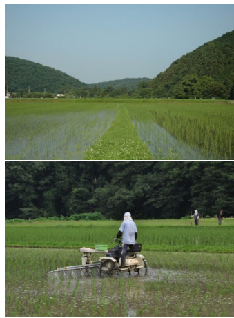
写真2 小川町の有機農業の 取組（下里地区：集落全体での 有機農業の実践）