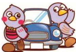
さいたまっち コバトン