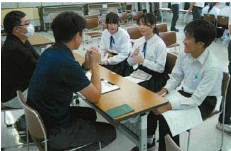
町役場の方と住みよい町づくりについて意見交換している様子