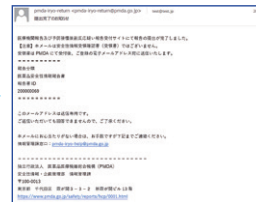
※実際の画面とは異なる場合があります

皆さまからの報告を起点に、厚生労働省、PMDA、製造販売業者など、医療にかかわる人たちが報告情報を活用することで、日本の医療を支えています。