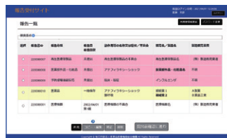
◀報告書登録済みの場合