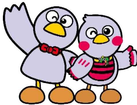
埼玉県マスコット コバトン&さいたまっち