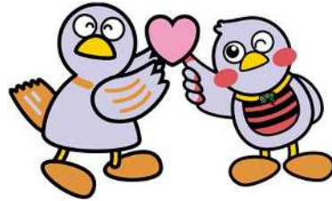
埼玉県マスコット 「コバトン&さいたまっち」