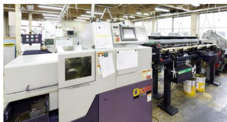
CNC 自動旋盤加工機を多数所持

現在 SUS303 φ3.0*2500 材から±0.002 真円度 1μ以下の公差部品を量産加工中。