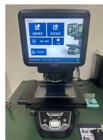
キーエンス LM1000 画像測定器