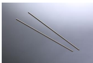
医療系シャフト L=250mm SUS303