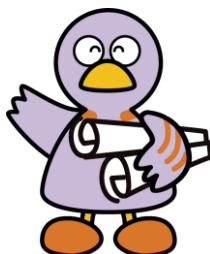
埼玉県のマスコット「コ・パン」