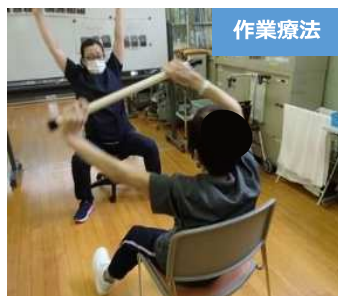
パーキンソンラン棒体操