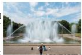
北浦和公園の音楽噴水

美術館の周囲や、目の前の北浦和公園内の「彫刻広場」には、国内外の作家による様々な立体作品が展示されています。また、公園内には音楽噴水もあり、自然とアートを満喫できるスポットとなっています。