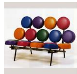
ネルソン・マッシュマロ・ソファ

館内の無料エリアにはデザイン椅子を数多く展示しており、見るだけでなく自由に座って楽しむことができます。どんな椅子が待っているのか、親子で美術館を探検してみてください。