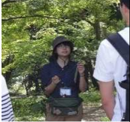
県内の植物・地衣類の分布・生育状況、博物館における市民活動の社会的意義