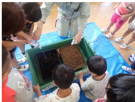
【森林環境学習の様子】