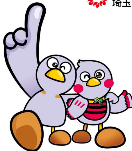
埼玉県マスコット「コバトン&さいたまっち」