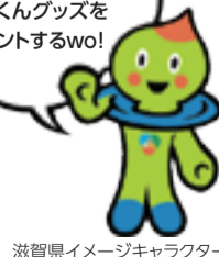
滋賀県イメージキャラクター うおーたん