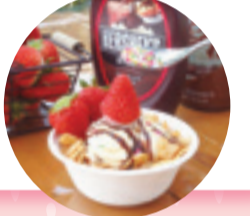
無料トッピングの例▶

栽培品種 章姫、かおり野、紅ほっぺ 住所 毛呂山町西戸781-6 ★東毛呂山駅武州長瀬駅下車、車で5分 開園期間 1月初旬~5月末まで 営業時間 午前10時~午後3時 定休日 月曜 ★WEBで要予約 TEL 090-6474-4115