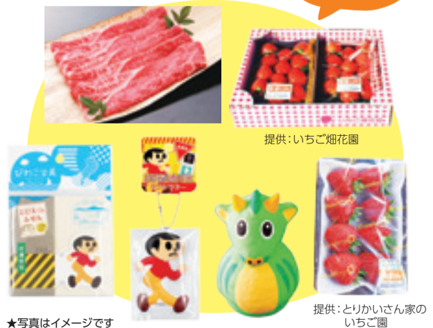
★写真はイメージです