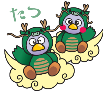
埼玉県マスコット 「コバトン」「さいたまっち」