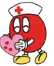
埼玉県献血マスコット「エビオ君」

生きるために必要不可欠な血液は、医療技術が進歩した現在でも、人工的に造ることができず、長期保存もできません。県では毎日約700人分の血液が必要です。命をつなぐボランティア、献血にご協力をお願いします。