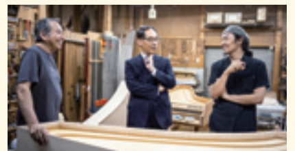
▲大野知事とともに訪問

埼玉県は、実はチェンバロの名産地。新座市の「久保田チェンバロ工房」は、1981年創業、実績も製造台数も日本一を誇る工房です。近藤監督は大野知事とともに、形も大きさも装飾もさまざまなチェンバロに触れ、その仕組みを学び、制作過程を見学し、チェンバロ愛を深めました。