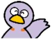
사이타마현의 마스코트 「코바톤」