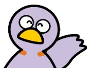
KOBATON; mascote da Província de Saitama