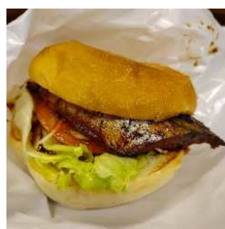
▲国見バーガー（国見町）