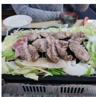
▲ジンギスカン（平田村）