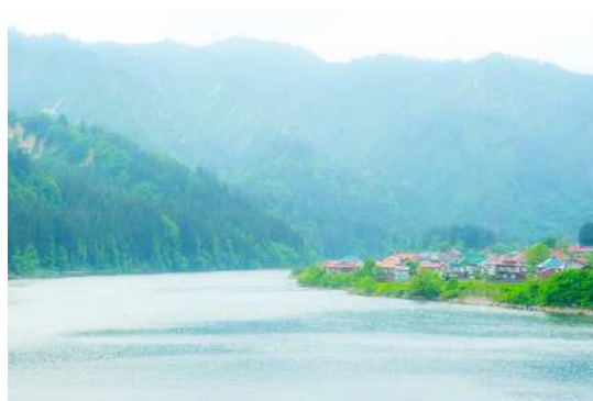
▲ 5月・大志集落（金山町）