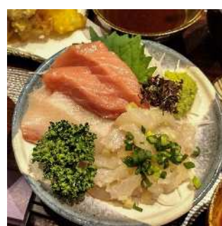
▲常磐ものの刺身（いわき市）