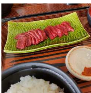
▲馬刺し（会津坂下町）