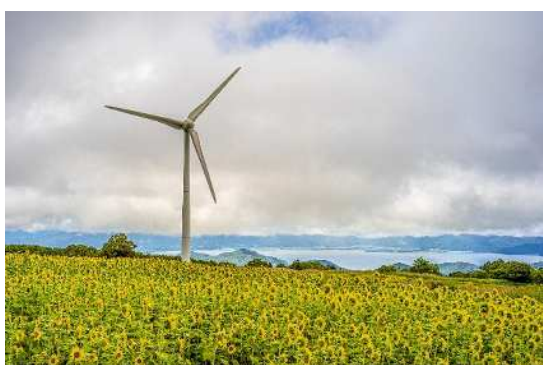
▲ 8月・布引高原と猪苗代湖（郡山市）