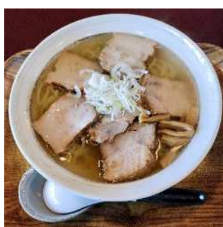
▲会津山塩ラーメン（北塩原村）