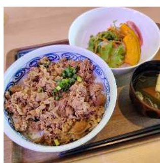
▲飯舘牛の牛丼（飯舘村）