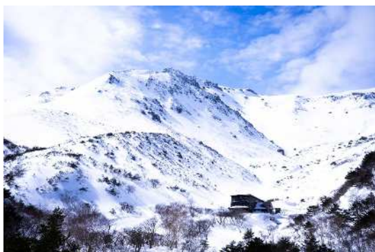
▲ 2月・安達太良山（二本松市）

埼玉と福島の縁は思っていた以上に深いと実感しました。埼玉に戻ってからも福島の魅力を人に伝えたり、微力ながらも被災地への支援を続けることで、派遣によってできた縁を大切にしていきたいです。