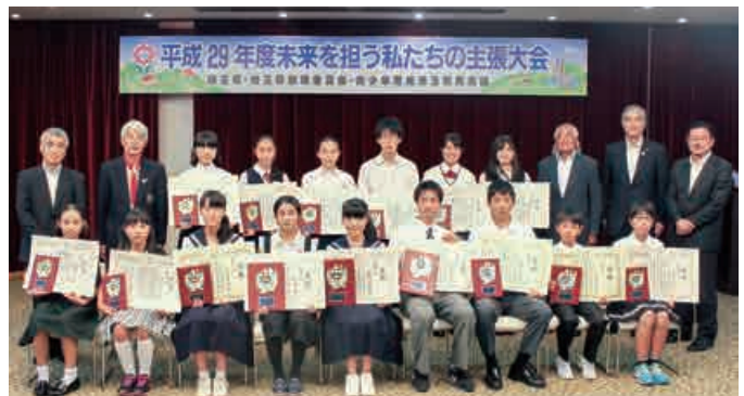
(大会発表者15名の皆さん)