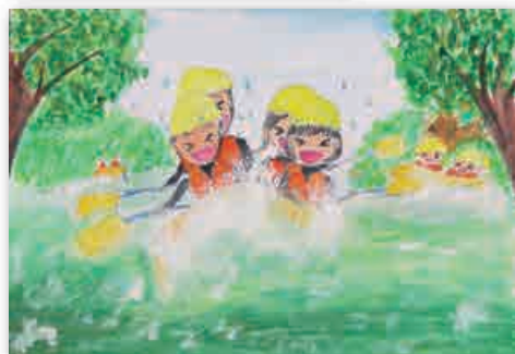
小学生の部 優良賞