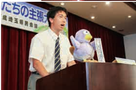
(発表の様子(上から小学生、中学生、高校生・一般の部))