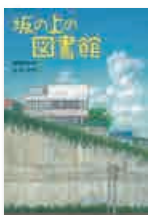
「坂の上の図書館」 さ・え・ら書房