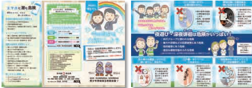
(非行防止リーフレット (三つ折り))

リーフレットは、夜遊び・深夜徘徊は危険がいっぱい!と注意喚起するとともに、スマートフォンに潜む危険やフィリタリングサービスの徹底などを啓発する内容となっています。