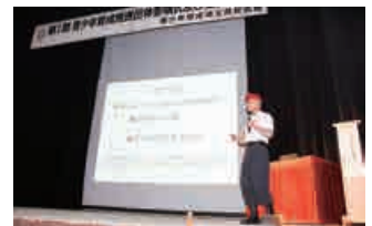
(全体研修会の様子)