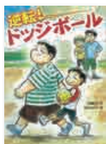
「逆転! ドッジボール」 あかね書房

埼玉県では青少年の健全な育成を図るために、特に優良と認められる図書を埼玉県推奨図書として推奨しています。