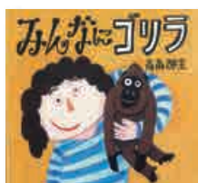
「みんなにゴリラ」 ポプラ社