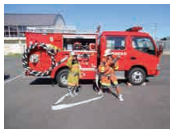
「消防士を体験しよう！」教室風景