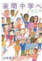
「夜間中学へようこそ」 岩崎書店