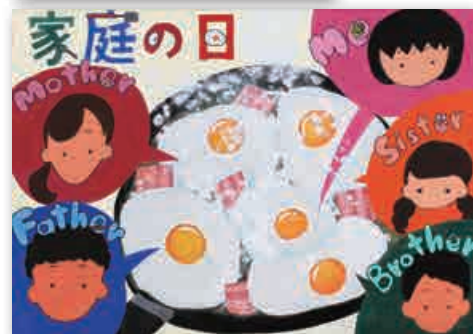
中学生の部 優良賞