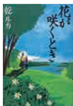
「花が咲くとき」 祥伝社