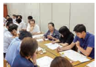
(意見交換会の様子)

また、青少年育成推進団体の活動上の課題についての意見交換も行われ、団体の確保策等について、参加者の間で活発な意見が交わされ、情報を共有しました。