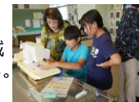
ミシンボランティア