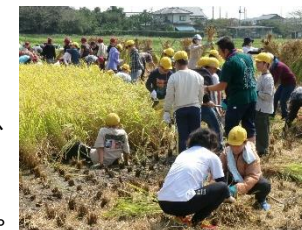
◁【ふるさと体験活動】 「2校合同 田植え・稲刈りの体験学習」