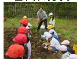
園芸ボランティア