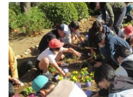
花はなプランで花壇の整備