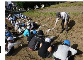
さつまいもの栽培