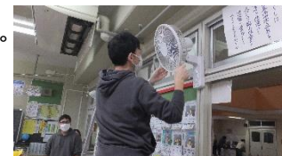
扇風機の清掃の様子