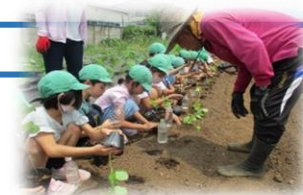
学校ファーム 農業体験