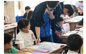
小・高交流事業 KISEPまなびあい

本校に隣接する水田を学校応援団のご厚意によりお借りして苗の植え付けから稲刈りまでの一連を体験している。収穫したお米は調理実習や給食で児童らがいただいている。