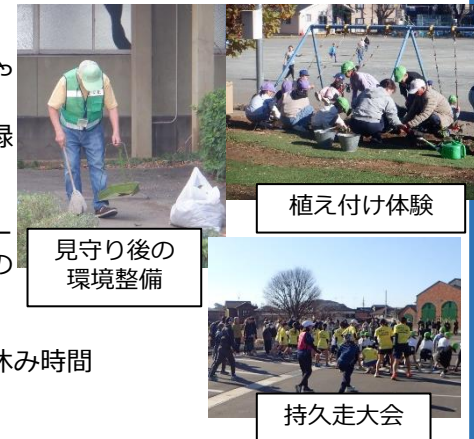
見守り後の 環境整備