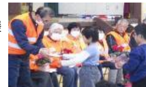
ありがとう集会で 学校応援団の方々に感謝