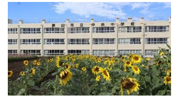
協力して種まきをしたひまわり