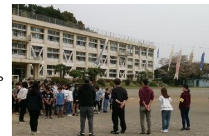
◁【ふるさと体験活動】 「鯉のぼりあげ」