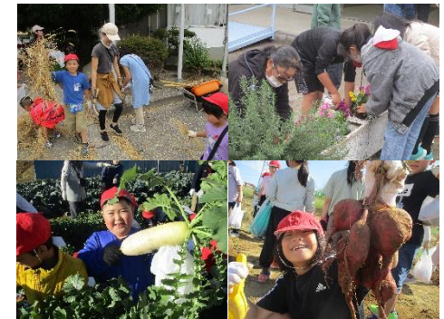
上段：環境整備の様子

毎年、こむろ農園において1年生は大根、2年生と特別支援学級はさつまいも、3年生はじゃがいも、4年生はブロッコリーを育てている。子供たちは、植え付け時には小さかった種や苗が、大きく育つことに驚きと喜びを感じている。また、大根については、町立小・中学校の学校給食にも活用されている。