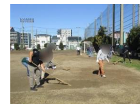
校庭整備ボランティア