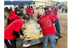
〔ひかり祭でのおやじの会のジャンボチャーハンづくりの様子〕