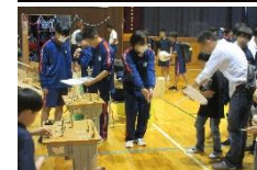
上中祭午前の部(上) 午後の部(下)