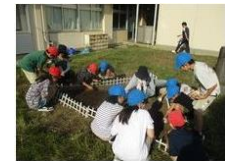
〔学校応援団と栽培委員会児童とで花を植える様子〕

保護者、地域住民が学校の教育活動を支えるための持続可能な取組にするために、「できる人が、できるときに、できることを」をモットーに掲げている。また、学校を支えるという視点だけでなく、保護者、地域住民が自身の得意や学びを生かすという視点ももち、「子供を育て、大人も育つ」ことを目指して取り組んでいる。