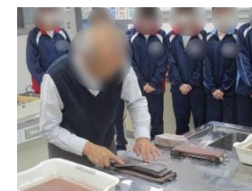
包丁研ぎボランティア