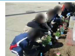
花植えボランティア