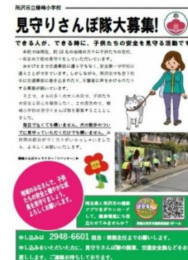
見守りさんぽ隊のチラシ