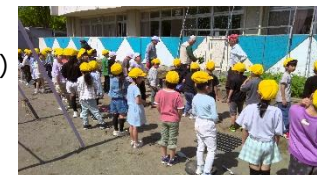
野菜づくりの様子