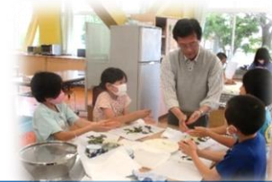
ふるさと科 お茶づくり体験