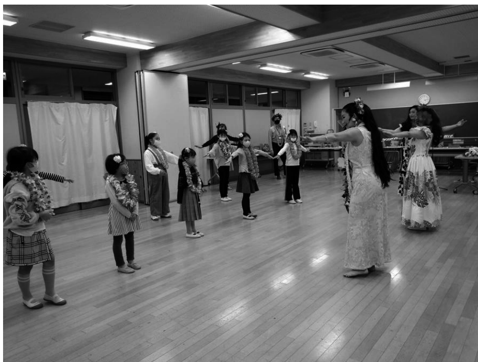
【楽しいフラ教室 ～ダンサーになろう！～】 和光市子ども教室