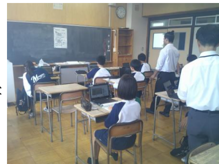
学習動画を活用した学習