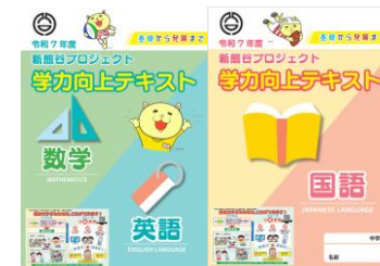
〔学力向上テキスト〕