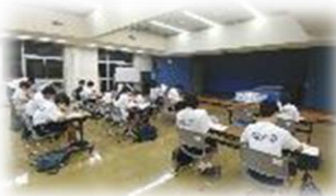
(学習に取り組む生徒の様子)