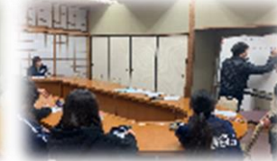
(熱意のある講義の様子)