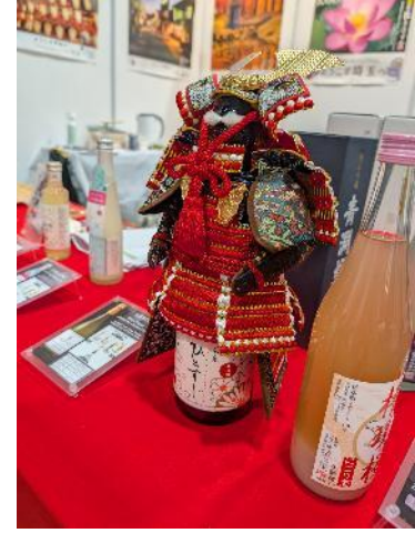
日本酒、狭山茶、梨サイダーの試飲。煮魚、芋ケンピの試食。足袋、甲冑の展示。