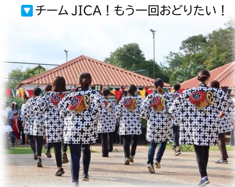
▼チーム JICA！もう一回おどりたい！