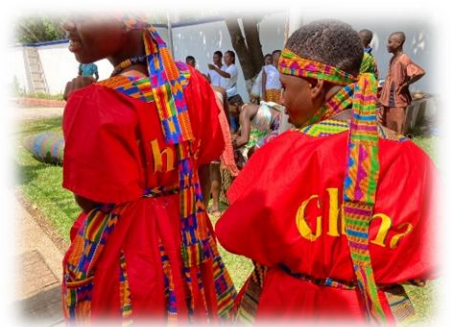
▲学校ごとにちがうよさこいの衣装！派手な色が似合う♪