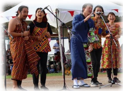
▲アカペラもしました♪リードボーカルどきどきした～！

問題！ ガーナに最初のボランティアが来たのは何年前でしょう。最後まで読んだら分かるかも？