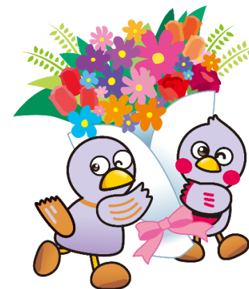
埼玉県のマスコット