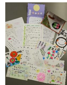
自宅で絵手紙を描いて、敬老の日に合わせてお届けしたものの