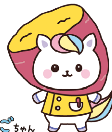
埼玉県 かんごちゃん