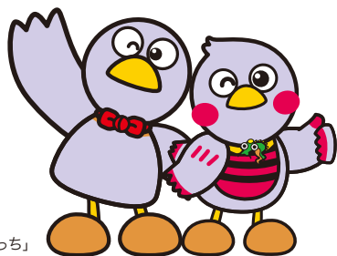
埼玉県のマスコット 「コバトン&さいたまっち」

〒331-0078 埼玉県さいたま市西区西大宮 3-3 公益社団法人 埼玉県看護協会研修センター内 TEL 048-620-7337 FAX 048-620-7322