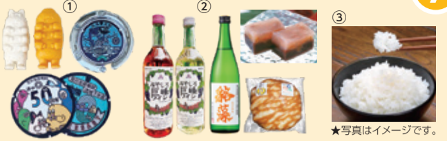
★写真はイメージです。

▶5人に①埼玉の下水道マスコットグッズ詰め合わせ、▶2人に②利根地域のおいしいもの詰め合わせ(みやしろ巨峰ワイン1本、清酒 貉藻1本、無花果羊かん1本、ありの実どらやき3個)、▶10人に③彩のきずな(5kg)、▶10人に④コパトン・さいたまっちょ図書カード(500円)、▶10人に⑤コパトン・さいたまっちょカード(500円)