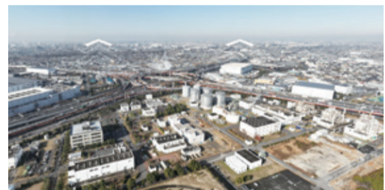
ドローンで空からの視点も。施設の大きさが分かるね

360度の視点で体感できます。実際の施設見学では見ることのできない設備も特別に公開!