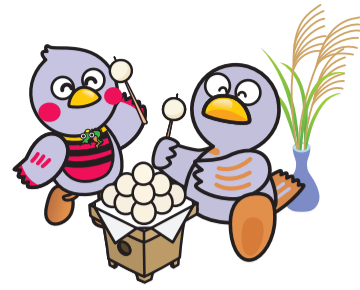
埼玉県マスコット 「さいたまっち」「コバトン」