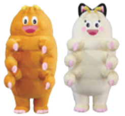
埼玉の下水道マスコット「クマムシくん」「クマニャンコちゃん」