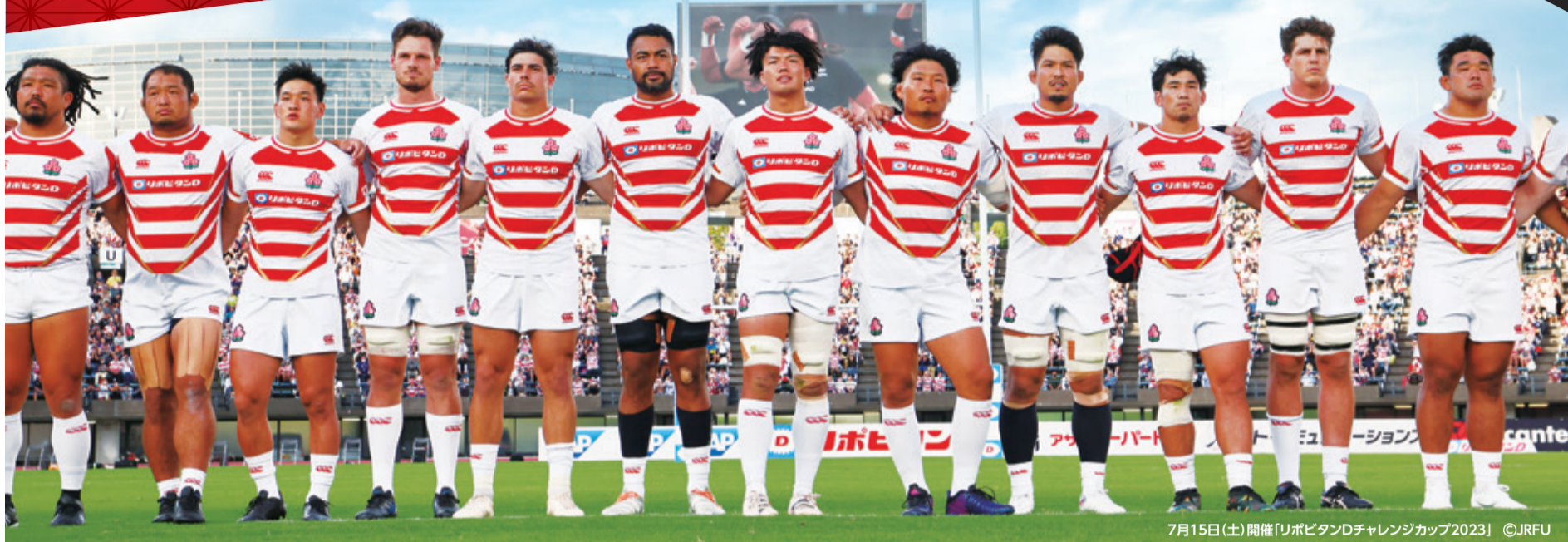
7月15日(土)開催「リポビタンDチャレンジカップ2023」

日本中が熱狂した前回大会から4年。再びあの興奮が帰ってきます。次の舞台はフランス。前回大会を上回るベスト4以上を目標に掲げる日本代表の戦いに熱い声援を送ろう!