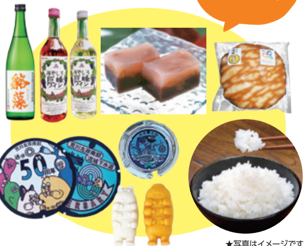
★写真はイメージです。